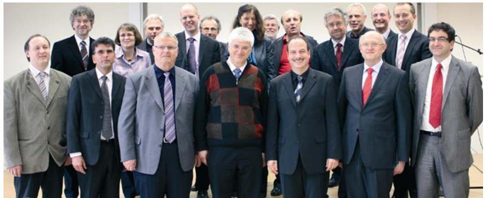
Die „ausgezeichneten“ nebenberuflichen Dozenten. In einer Feierstunde wurde ihre Leistung gewürdigt.