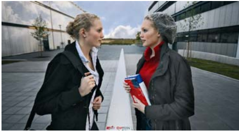
Siegerbild 2009 von Dominik Gebhardt, Student an der DHBW Mannheim

„Die Gesichter der DHBW“ lautet das Motto des zweiten Fotowettbewerbs, der zum einjährigen Geburtstag der Dualen Hochschule ausgelobt wurde.