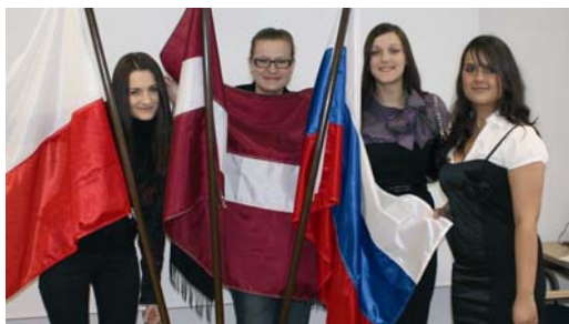
Im Dezember nahmen vier Gaststudentinnen Abschied.

Während einer Abschiedsfeier in vorweihnachtlicher Stimmung berichteten vier Studentinnen von ihren Erfahrungen